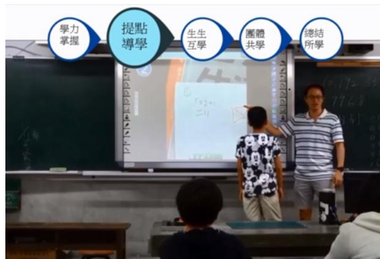
教師佈題，誘發孩子的多元思考，師生一問一答，釐清孩子觀念